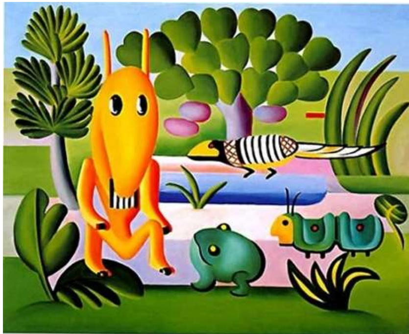
A Cuca - 1924